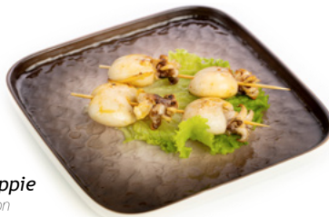
240 Kaisen Tori Seppie spiedini di seppie con salsa teriyaki