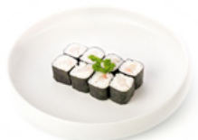
065 Hoso Suzuki rotolino con branzino € 4.00