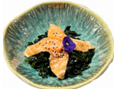
005 Sake Su insalata di alghe con salmone € 5.00