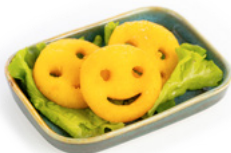
223 Patate Fritte € 5.00