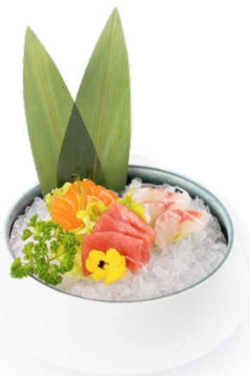
174 Sashimi Mix sashimi misto € 12.00