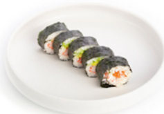
125 Futo California surimi di granchio, tobiko, avocado e salmone philadelphia € 8.00