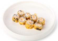
071 Hoso Fritto rotolino con salmone e salsa teriyaki € 4.00