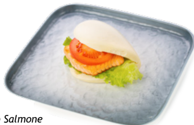
026 Bao Salmone salmone alla piastra insalata, pomodoro e salsa teriyaki