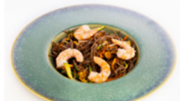
188 Yaki Soba Ebi spaghetti di grano saraceno saltati con gamberi, verdure e uova € 7.50