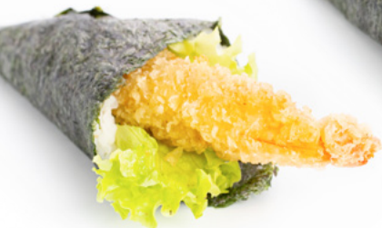
044 Temaki Ebiten gamberone in tempura, insalata e salsa teriyaki € 4.00