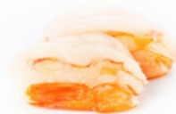
144 Nigiri Amaebi