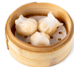
019 Ebi Cristallo ravioli di gamberi in cristallo al vapore € 6.00