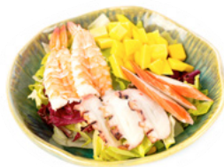
030 Thai Salad insalata mista, frutti di mare, mango, ananas e cocco € 5.00