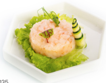
035 Tartare Amaebi tartare di gamberi crudi € 10.00