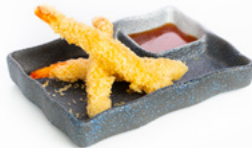
228 Ebi Tempura tempura di gamberi € 11.00