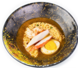
181 Ramen Style ramen in brodo con uova, surimi di granchio e gamberi € 7.00