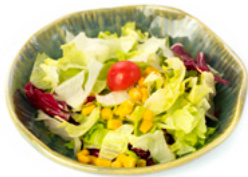
027 Yasai Salad insalata mista, pomodoro e mais € 4.00