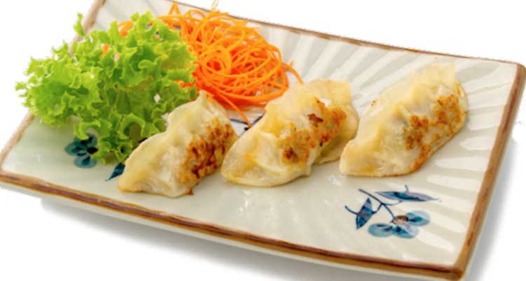
020 Yaki Gyoza ravioli di carne alla griglia