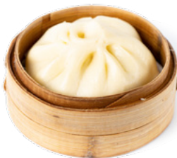
023 Bao Pork bao al vapore con maiale € 4.00