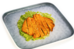
227 Tonkatsu cotoletta di maiale impanato fritto € 7.00