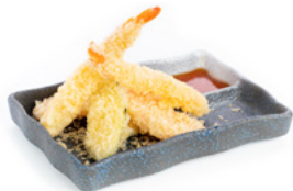
230 Tempura Mista tempura di gamberi e verdure € 9.00