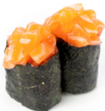
154 Gunkan Sake tartare di salmone e alga nori all'esterno € 4.00