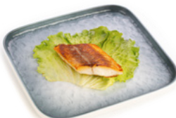
238 Suzuki Teppanyaki filetto di branzino alla piastra