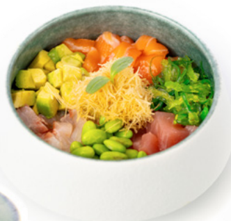
137 Poke Elite

salmona, avocado, mango, gamberi cotti, gome wakame, granelle di cipolla frita e salsa teriyaki