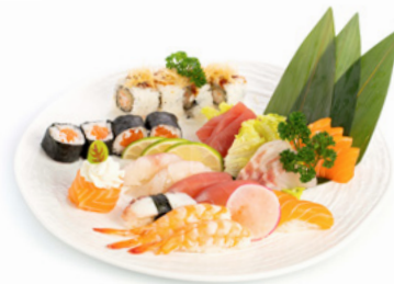
169 Barca Per 1 Persona 9pz nigiri, 7pz sashimi, 4pz hosomaki, 4pz uramaki, 1pz gunkan