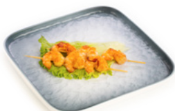
235 Ebi Kushi Yaki spiedini di gamberi