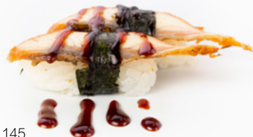
145 Nigiri Unagi