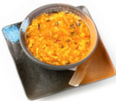
183 Zuppa Agro Piccante tofu, uova, bambù e verdure miste € 4.00