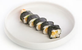
126 Futo Maki Ebiten tempura di gamberi, avocado, maionese, pasta kataifi e salsa teriyaki € 10.00