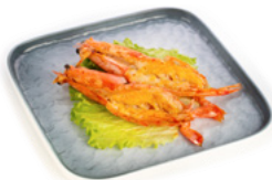
236 Ebi No Shioyaki gamberoni alla piastra