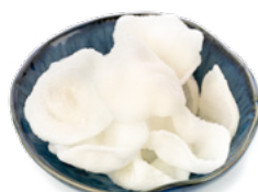
010 Nuvole Di Drago € 3.00