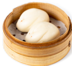
016 Pane Crema pane con crema all'uovo € 5.00