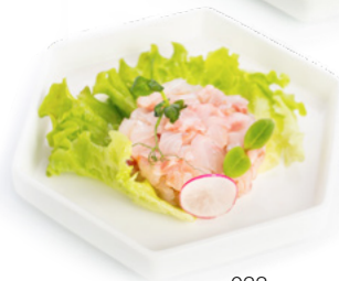
033 Tartare Branzino € 7.00