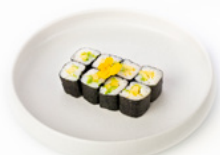
067 Hoso Avocado rotolino con avocado € 3.00