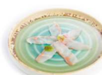
130 Carpaccio Di Branzino € 9.00