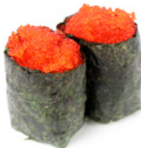
157 Gunkan Tobiko uova di pesce volante € 3.50