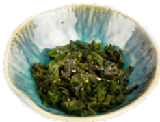
004 Wakame insalata di alghe € 4.00