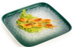
234 Yaki Tori spiedini di pollo con salsa teriyaki