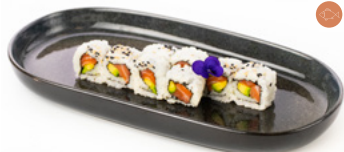
079 Uramaki Sake salmone e avocado € 8.00