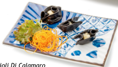
022 Ravioli Di Calamaro sfoglia al nero di seppia con calamaro