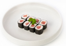
064 Hoso Tuna rotolino con tonno € 5.00