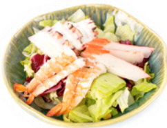
028 Kaisei Salad insalata ai frutti di mare € 5.00