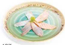
127 Carpaccio Misto Scottato

carpaccio di salmone, tonno, branzino e salsa ponzu