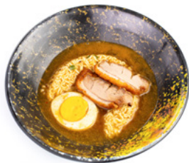
180 Ramen Con Manzo ramen in brodo con manzo, uovo e erba cipollina € 8.00