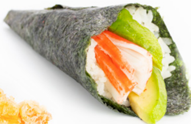
045 Temaki California surimi di granchio e avocado