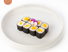
068 Hoso Mango rotolino con mango € 3.50