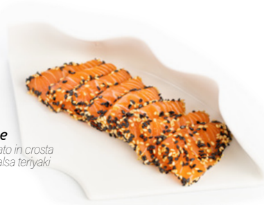
241 Tataki Sake salmone scottato in crosta di sesamo e salsa teriyaki