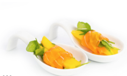
039 Involtini Di Salmone salmone con rucola e mango € 5.00