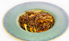
187 Yaki Soba spaghetti di grano saraceno saltati con verdure e uova € 6.50