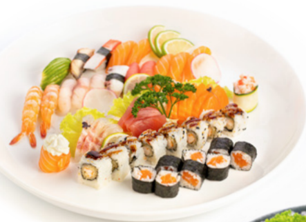
170 Barca Per 2 Persone 15pz nigiri, 13pz sashimi, 8pz hosomaki, 8pz uramaki e 2pz gunkan