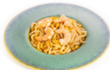
186 Ebi Yaki Udon spaghetti con gamberi, verdure e uova € 7.00