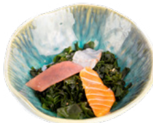
006 Suonomono insalata di alghe con misto di pesce € 6.00