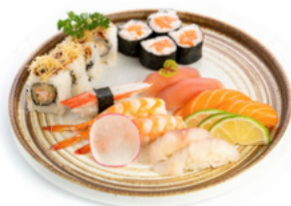
168 Sushi Medio 9pz nigiri, 4 pz uramaki, 4 pz hosomaki