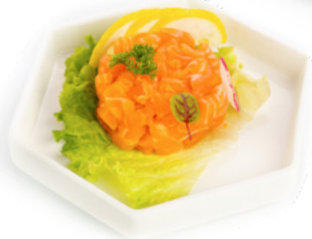
031 Tartare Salmone € 7.00