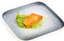
237 Sake Teppanyaki salmone alla piastra