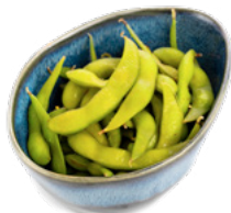
001 Edamame baccelli di soia e sale € 4.00