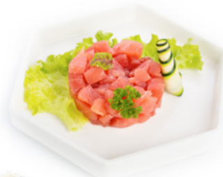
032 Tartare Tonno € 8.00