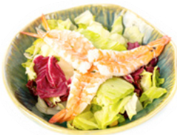
029 Ebi Sala insalata mista con gamberi cotti € 6.00