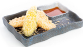
229 Yasai Tempura tempura di verdure miste € 7.00