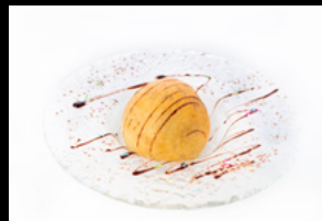
Gelato Fritto € 5.50