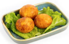
222 Tako Yaki polpette di polipo € 5.00