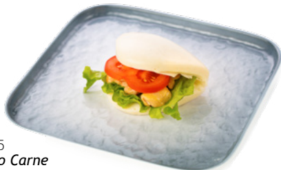
025 Bao Carne pollo, pomodoro, insalata e salsa teriyaki