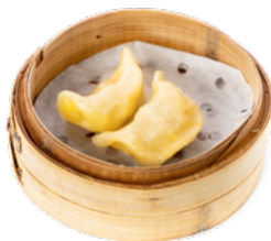
018 Gyoza ravioli di carne € 5.00