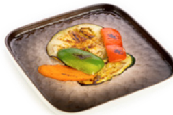
239 Yasai Teppanyaki verdure miste alla piastra