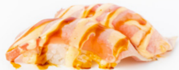
149 Maguro Scottato

tonno scottato, salsa piccante e teriyaki