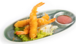
231 Ebi Nido gamberi avvolti da pasta kataifi € 12.00