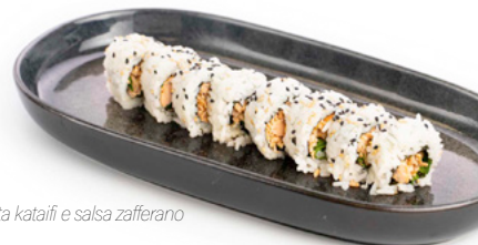
092 Gio Tuna tonno, avocado, pasta kataifi e salsa zafferano € 11.00