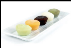
Mochi € 6.00