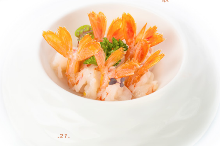
175 Sashimi Sake sashimi di gambero crudo € 12.00