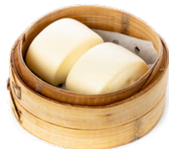
015 Pane Al Vapore € 4.00