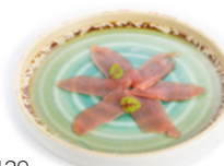
129 Carpaccio Di Tonno € 10.00