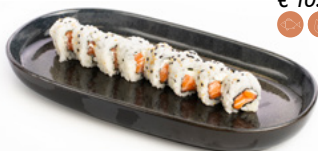
084 Uramaki Philadelphia salmone e philadelphia € 10.00