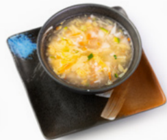
184 Zuppa Frutti Mare uova, asparagi, polipo, gamberi, branzino e surimi di granchio € 5.00