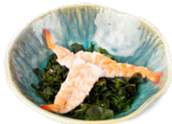
008 Gamberi Su insalata di alghe con gamberi cotti € 5.00