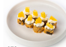
073 Hoso Fritto Mango rotolino con salmone, sopra philadelphia e mango salsa mango € 5.00