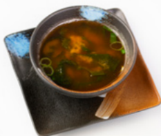
182 Zuppa Miso zuppa di soia con alghe e tofu € 3.00