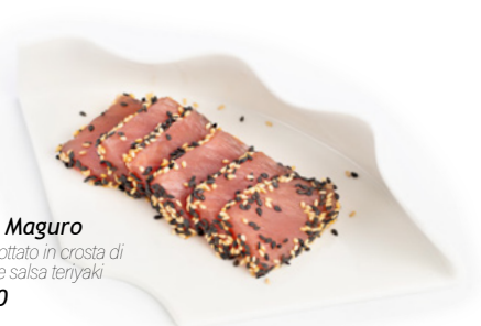
242 Tataki Maguro tonno scottato in crosta di sesamo e salsa teriyaki