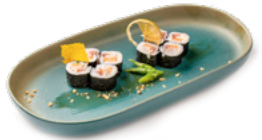
066 Hoso Misto rotolino con pesce misto € 4.50