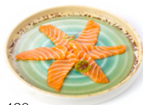
128 Carpaccio Di Salmone € 8.00