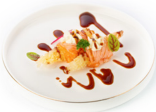
041 Salmone Roll tempura di gamberi con esterno carpaccio di salmone scottato, philadelphia e salsa teriyaki € 8.00