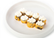
074 Hoso Philadelphia rotolino con avocado, sopra philadelphia e salsa teriyaki € 4.50