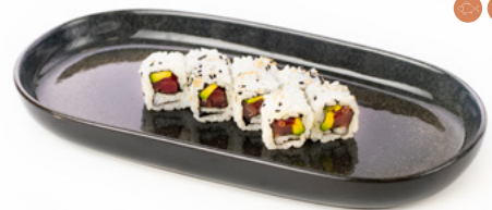
091 Oni Maki tonno cotto e rucola € 10.00