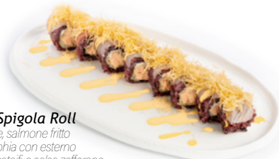
123 Crispy Spigola Roll riso venere, salmone fritto e philadelphia con esterno branzino, kataifi e salsa zafferano € 12.00