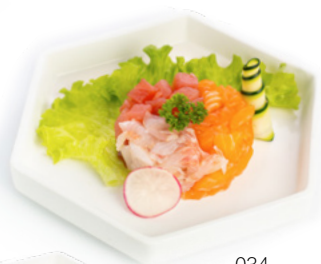
034 Tartare Misto pesce misto € 9.00