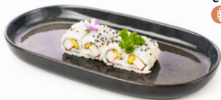
078 Uramaki California surimi di granchio e avocado € 7.00