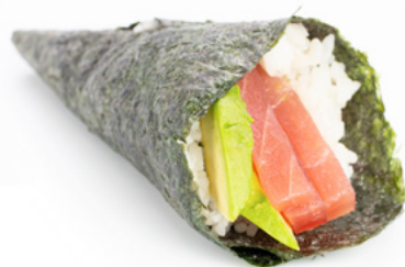
046 Temaki Tuna tonno e avocado € 4.00