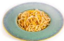
185 Yaki Udon spaghetti saltati con verdure e uova € 6.00