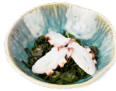
007 Tako Su insalata di alghe con polipo € 5.00