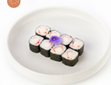
069 Hoso California rotolino con surimi di granchio € 3.00