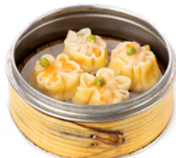
017 Ebi Shumai ravioli di gamberi € 6.00