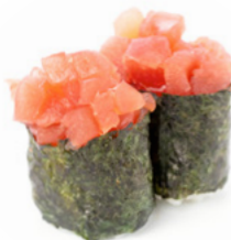
155 Gunkan Tuna tartare di tonno e alga nori all'esterno € 3.00