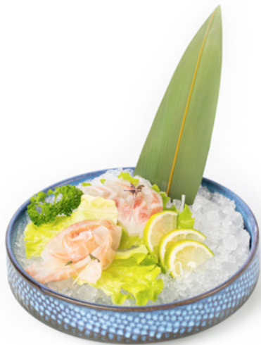
173 Sashimi Suzuki sashimi di branzino € 12.00