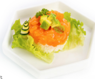
036 Salmone Con Riso tartare salmone con sopra riso, avocado e salsa teriyaki € 10.00