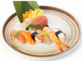
167 Sushi E Sashimi Mix 6pz di nigiri misto e 7pz di sashimi misto