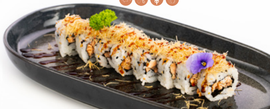
085 Uramaki Miura salmone cotto, philadelphia, kataifi e salsa teriyaki € 9.00