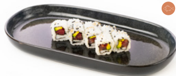
080 Uramaki Tuna tonno e avocado € 9.00