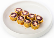
072 Black Hoso Fritto rotolino di riso verene con salmone e salsa teriyaki € 4.00