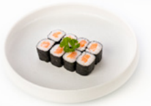
063 Hoso Sake rotolino con salmone € 4.00