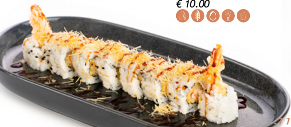
081 Uramaki Ebiten gamberone in tempura, maionese, kataifi e salsa teriyaki € 10.00