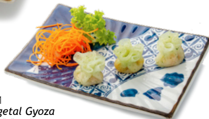
021 Vegetal Gyoza ravioli di verdure